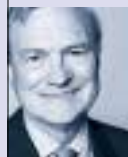
Claude Bébéar Président du Conseil de surveillance d'AXA