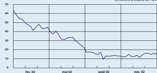
Cours de l'action sur l'année 2002 en euros à la bourse de Paris

Pour l'année 2003, le Groupe confirme son objectif de céder pour 7 milliards d'euros d'actifs. Cette clarification du périmètre du Groupe devrait contribuer à la valorisation de l'entreprise.