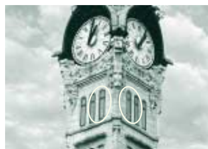
Exemple d'intégration d'antennes relais - Gare de Rouen (France).

Par ailleurs dans les activités télécommunications mobiles du Groupe Cegetel, SFR renforce l'intégration environnementale de ses installations dans la continuité des engagements pris à travers la Charte nationale signée en 1999 par SFR et les deux autres opérateurs de téléphonie mobile. Ainsi, de nouvelles solutions sont régulièrement étudiées et mises en place pour insérer au mieux les antennes relais dans leur environnement, avec l'aide d'architectes conseils et en concertation avec les architectes des bâtiments de France et les collectivités locales.