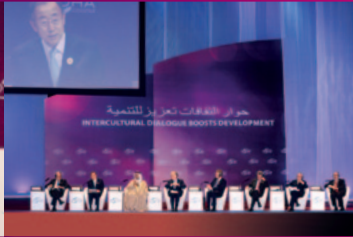
↑ L'Alliance des civilisations des Nations unies (UNAOC: United Nations Alliance of Civilizations) a réuni à Doha (Qatar), du 11 au 13 décembre 2011, la quatrième édition annuelle de son Forum. Son haut représentant, Jorge Sampaio, ancien Président de la République portugaise anime l'un des nombreux débats aux côtés de son Altesse Cheikha Moza Bint Nasser, ambassadrice de l'UNAOC (ci-dessus à gauche). Le secrétaire général des Nations unies, Ban Ki-moon (ci-dessus au centre), participe à la session d'ouverture de ce Forum qui a réuni près de 2000 participants venus de 130 pays et de nombreuses personnalités (ci-dessus à droite).

Vivendi et l'Alliance des civilisations des Nations unies partagent l'ambition d'inscrire la promotion de la diversité culturelle et le dialogue interculturel dans l'agenda mondial du développement durable. Dans la totalité de sa sphère d'influence, Vivendi entend promouvoir les droits humains par son activité de production et de distribution de contenus et son offre de services. Les métiers du groupe jouent en effet un rôle majeur pour renforcer la compréhension mutuelle et le lien social. En choisissant de promouvoir la diversité culturelle sur les différents continents où le groupe est présent, en investissant massivement dans les contenus et les réseaux,