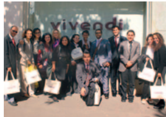
↑ Vivendi a reçu une délégation de quinze jeunes dirigeants du Moyen-Orient et du Maghreb dans le cadre du Fellowship Programme de l'Alliance des civilisations des Nations unies.

Vivendi a présenté ses orientations stratégiques en matière de développement durable à une quinzaine de jeunes dirigeants du Moyen-Orient et du Maghreb venus à Paris, en septembre 2011, dans le cadre du Fellowship Programme de l'Alliance des civilisations des Nations unies. Ce programme a pour objectif de construire des liens entre des jeunes