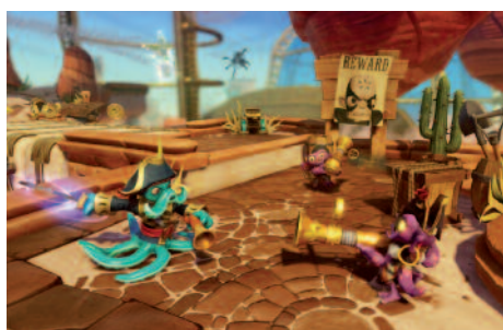
SKYLANDERS : PLUS DE 100 MILLIONS DE FIGURINES VENDUES DEPUIS LA CRÉATION DU JEU

Pour 2013, la perspective d'EBITA est supérieure à 1 milliard de dollars. Ce montant important est néanmoins inférieur au très bon chiffre enregistré en 2012. Une différence qui s'explique par un environnement économique difficile, l'arrivée prochaine des consoles de nouvelle génération, et le record enregistré par Diablo III en 2012. ■